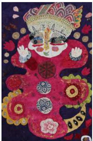
LE ROI EN SON MONDE