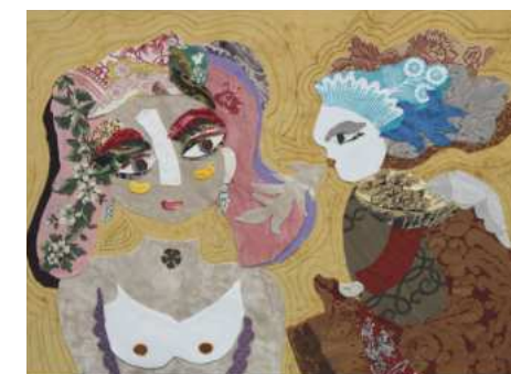
LE SOUFFLE DE LA TENTATION