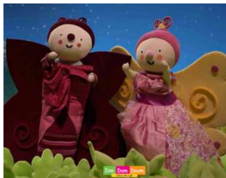
2002/2004 DIM DAM DOUM LES PETITS DOUDOUS