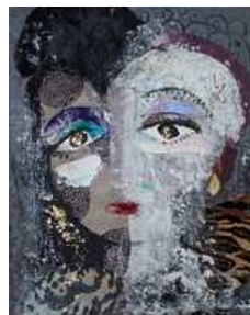
2014/2015 PROJECTION DE PEINTURE

... Première expo au château de Gordes (90) en 1993