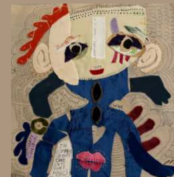
COLLAGES SUR TOILES DE LIN CRAYONNÉS 50X50 CM