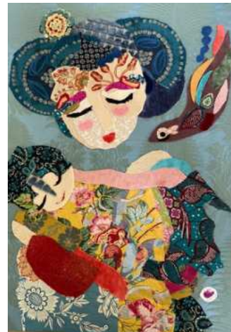
LA VISITE DE L'OISEAU