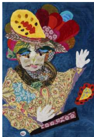
LE REFUS DE L'OISEAU