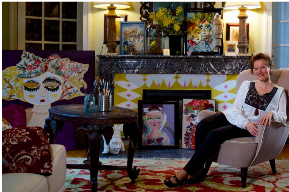
L'ARTISTE DANS SON SALON À STE GEMMES SUR LOIRE -2018