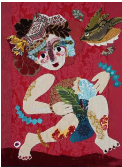
LA LYRE ROUGE