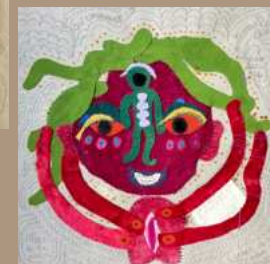
2022- SÉRIE PSYCHIQUE - L'ENFANT BLESSÉ