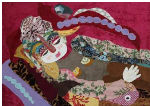
LA SIESTE ROUGE