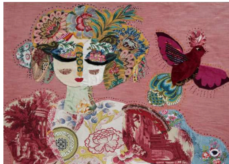
L'ENVOL DE L'OISEAU