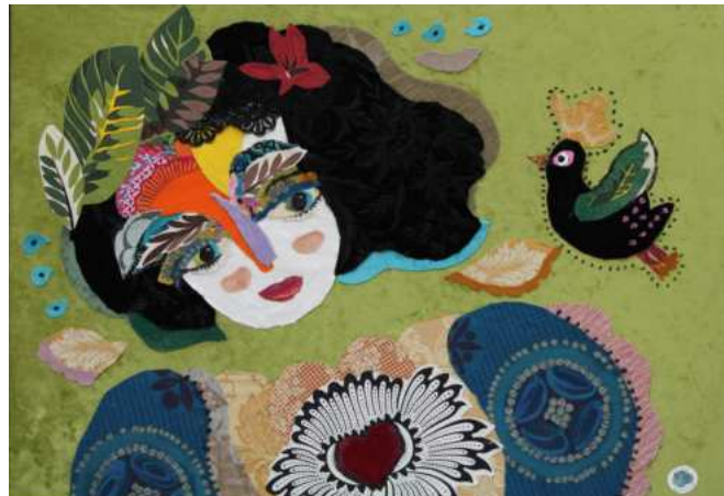
L'INVITATION DE L'OISEAU