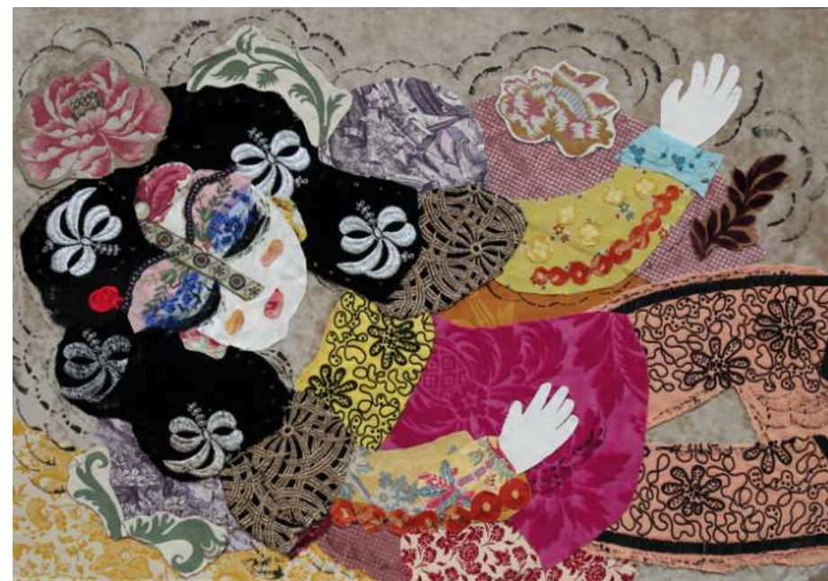
LES MILLE RÊVES

(...) Très sensible également à ce qu'expriment ces tissus d'ameublement de très grande qualité récupérés, ou offerts, Katherine Roumanoff se trouve avec chacun d'eux en résonance avec une époque, une histoire sociale, un contexte de fabrication, un mode d'impression ou de tissage (...) Ce voyage dans l'univers de l'artiste prend ses vraies couleurs au cœur de son atelier, au milieu des chutes éparpillées sur le sol et au gré des croquis qui ont parfois ébauché ses intentions.»