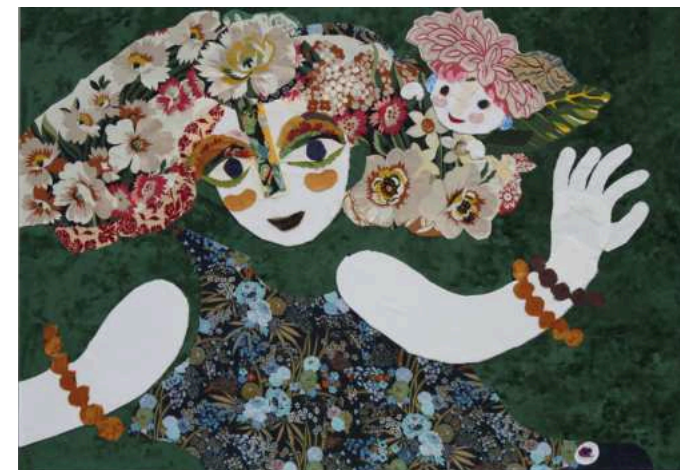
LA PROMENADE VERTE