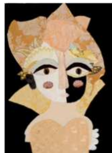
2010- VIDE ET PLEIN