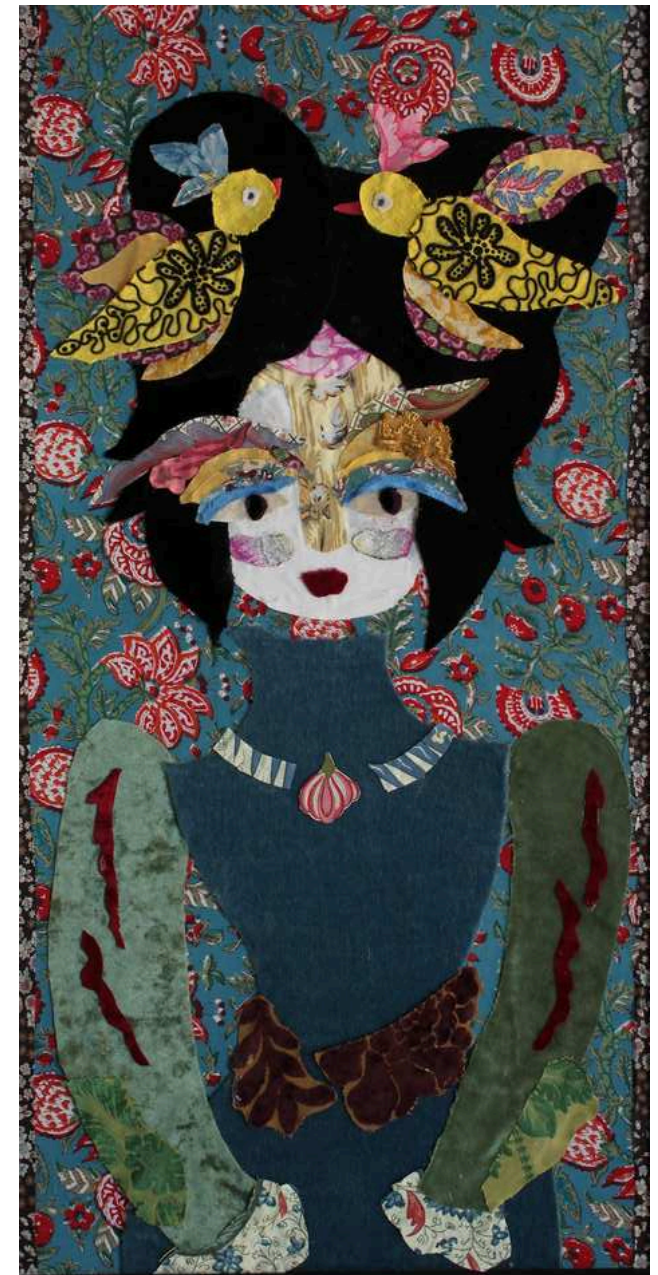
LA GUERRIÈRE AUX OISEAUX