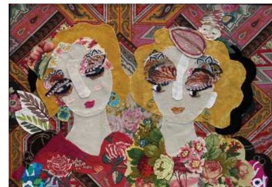
LES DEUX SOEURS