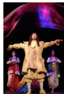
2000- CRÉATION DE COSTUMES DE THÉÂTRE