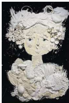
2020- LES TOILES SCULPTURES