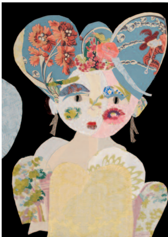
Full , 70 x 50 cm. Je suis pleine de tout, je suis pleine de toi. Pleine de désir, et pleine de joie. Adieu la peine, adieu l'effroi.

A la corderie Vallois, au milieu des machines à engrenage, les portraits, qui évoquent tous des histoires émouvantes, se côtoient en ayant l'air de s'épier, de dialoguer. Des personnages de tous âges, sereins, placides ou tourmentés. Une mère qui veille son enfant, deux sœurs, un couple : tous reflètent la joie ou la peine, la déception, la satisfaction, la surprise... bref tous ces personnages de tissu, sans nous parler, affichent les sentiments de l'être humain, le rêve, l'intime, le quotidien.